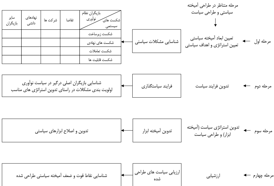
نمودار ۳- مراحل طراحی آمیخته سیاستی در جهت گذار به اقتصاد دانش بنیان (بر اساس Woolthuis, Lankhuizen and Gilsing 2005)

آمیخته سیاستی توسعه تقاضا و تولید محصولات دانش بنیان در آبان ۱۳۹۴ تدوین و نهایی شد و برای تصویب به هیأت دولت ارسال گردید. استراتژی‌های این آمیخته سیاستی در قالب آیین‌نامه اجرایی ماده ۴۳ قانون رفع موانع تولید رقابت پذیر و ارتقاء نظام مالی کشور در آذر ۱۳۹۴ با کمترین تغییر در فصل چهارم آیین‌نامه با عنوان برنامه‌های اقدام به تصویب هیأت دولت رسید. ۱۱ برنامه اقدام مصوب ۱ این آیین‌نامه، بر اساس استراتژی‌های مندرج در جدول ۳ برای اجرا به دستگاه‌های اجرایی ابلاغ گردید. فرایند پیشنهادی طراحی و تدوین آمیخته سیاستی در نمودار ۳ نشان داده شده است. در مرحله اول استراتژی‌ها ۲ بر مبنای مشکلات شناسایی شده مشخص خواهند شد. در این بخش از چارچوب سیاستی ارائه شده توسط ولتیس و همکاران استفاده شده است (Woolthuis, Lankhuizen and Gilsing 2005).