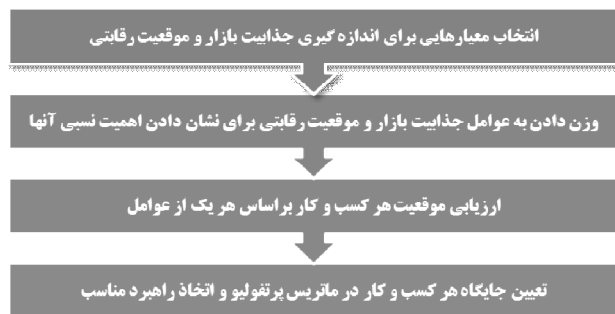
شکل ۲- مراحل طراحی یک ماتریس کسب و کار

بهره‌گیری از این روش، مدیران می‌توانند توان بالقوه آتی کسب‌وکارهای مختلف را با توجه به معیارهای یکسان مقایسه و نسبت به اولویت‌بندی و بهینه‌یابی حوزه‌های مناسب برای سرمایه‌گذاری اقدام نمایند. شکل ۲، مراحل طراحی یک ماتریس جذابیت بازار/موقعیت رقابتی را برای تجزیه و تحلیل کسب‌وکارها نشان می‌دهد.