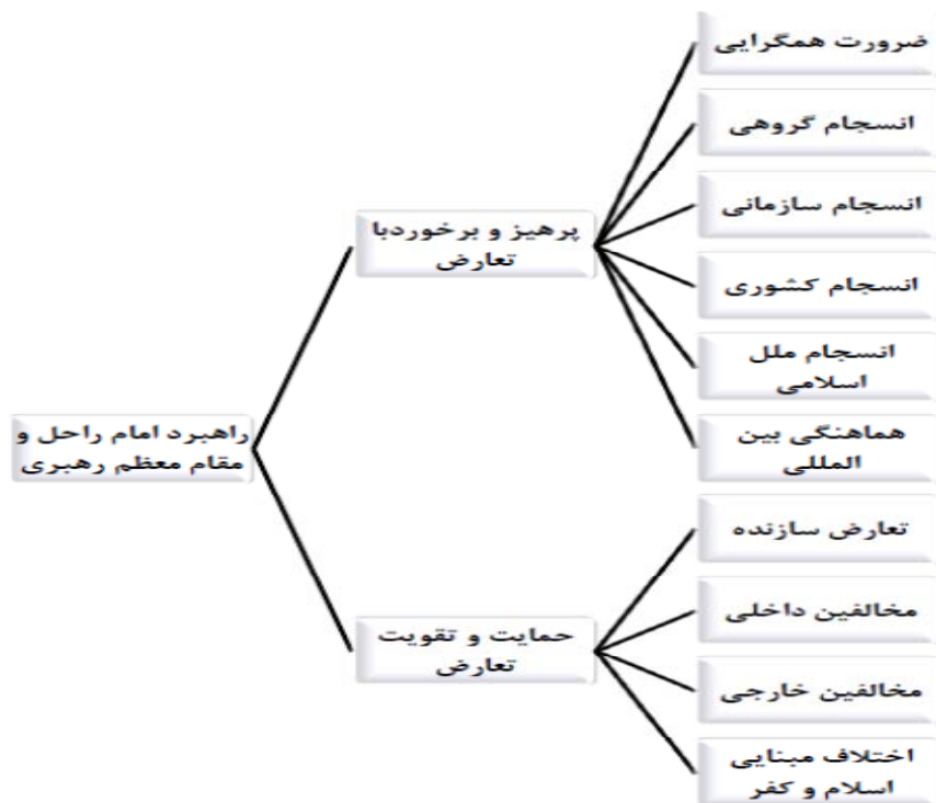
شکل ۲ - راهبرد مدیریت تعارض امام راحل و مقام معظم رهبری

انسجام تاکید داشتند، به گونه‌ای که با توجه به اهمیت آن در نام‌گذاری نمادین سال‌های شمسی، سال ۸۶ را به نام اتحاد ملی، انسجام اسلامی نام‌گذاری کردند.