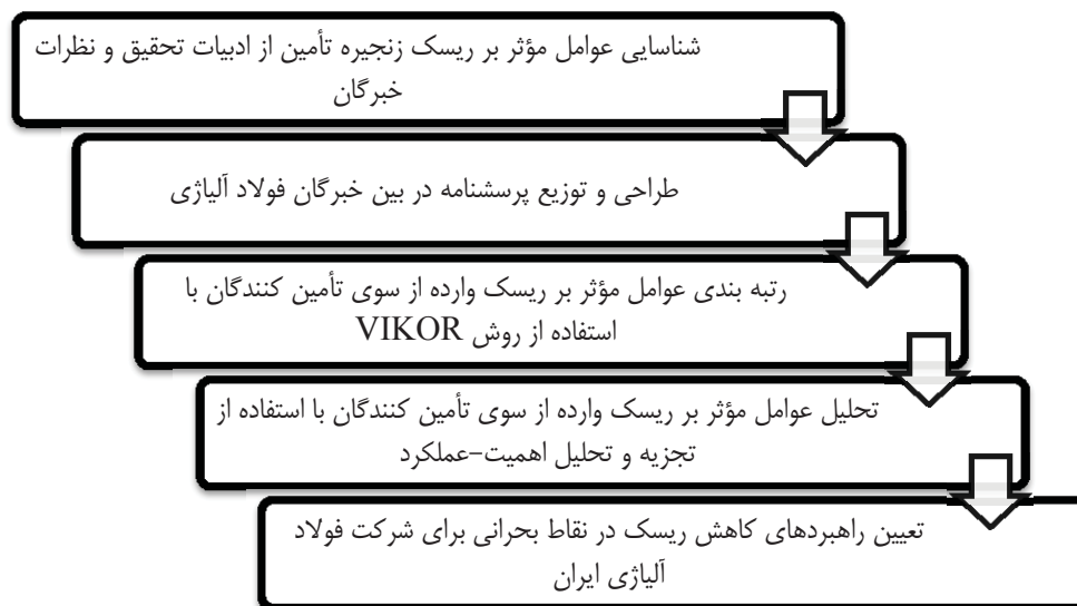
شکل ۱- چارچوب اجرایی تحقیق

راه کارهای تصمیم‌گیری چند معیاره روش‌هایی هستند که با استفاده از معیارهای کمی و کیفی چندگانه به رتبه‌بندی گزینه‌های تصمیم‌گیری می‌پردازند و تصمیم‌گیرندگان را در انتخاب یاری می‌کنند. روش‌های متعددی برای تصمیم‌گیری با چندین معیار ارائه شده است [۵۲]. در این تحقیق از راه کار VIKOR، به منظور رتبه‌بندی عوامل مؤثر بر خطر پذیری‌های وارده از سوی تأمین‌کنندگان، استفاده شده که در ادامه به توضیح آن پرداخته می‌شود.