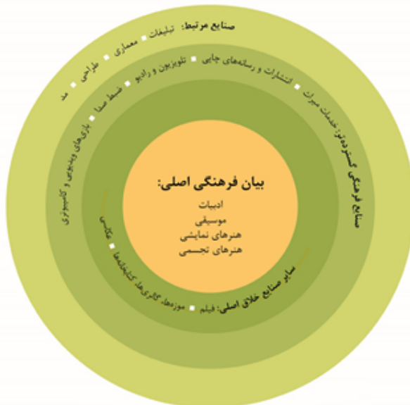
شکل ۱- مدل دایره‌های هم‌مرکز [۳۱]