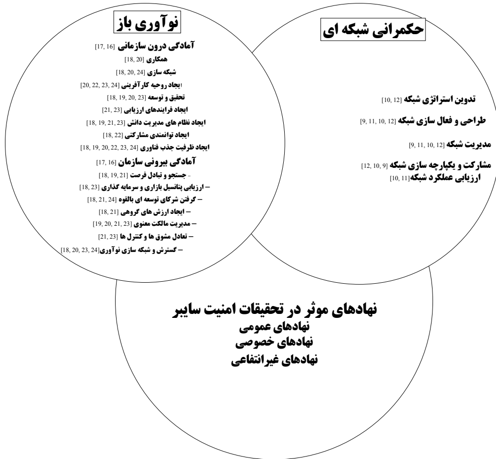
شکل ۱- چارچوب نظری تحقیق

مدل از الگوی ۱ PEST (عوامل سیاسی، اقتصادی، اجتماعی و فناورانه) بهره‌مند شده است که در شکل زیر قابل مشاهده است.