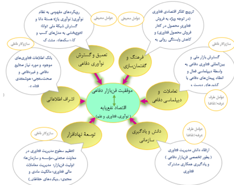
شکل ۴- مدل نهایی تحقیق از منظر راهبردهای اساسی موفقیت فن بازار (محقق ساخته)