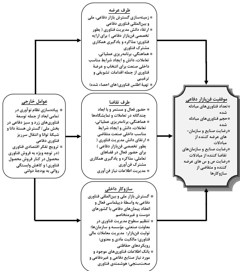
شکل ۳- مدل نهایی تحقیق با تکیه بر سازوکارهای پیشنهادی تحقیق (محقق ساخته)

انتخاب برای رشد و توسعه از ویژگیهای لازم برای فروش برخوردار بوده باشد به بیانی دیگر سازمان‌های طرف عرضه به سمت تولید فناوری‌هایی بروند که جزء نیازهای اساسی مشتریان بوده و اقتصادی باشد. همچنین به شایستگی بتوانند زمینه معرفی ویژگیها و جذابیت‌های پایه فناوری را برای طرف تقاضا فراهم آورند در شکل ۲، مدل نهایی تحقیق (از منظر شاخص‌ها و عوامل سنجش)، ارائه شده است. در شکل ۳، مدل نهایی پژوهش با تکیه بر سازوکارهای پیشنهادی مؤثر بر عوامل اصلی موفقیت فن بازار برگرفته از تلفیق تحلیل محتوای مصاحبه با خبرگان و نتایج تحلیل عاملی تاییدی نشان داده شده است.