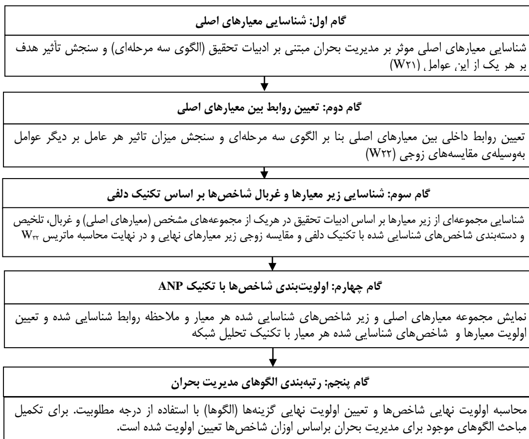
شکل ۲: مراحل گام به گام اجرای تحقیق

الگوریتم اجرایی این تحقیق، با هدف انتخاب الگوی مناسب تصمیم‌گیری در شرایط بحران سازمانی در شرکت ملی پخش فرآورده‌های نفتی، طراحی شده است. الگوریتم اجرایی تحقیق حاضر، بر اساس طی مراحل منظم و مبتنی بر روش تحقیق علمی، طراحی شده است. هر یک از مراحل انجام شده در راستای نیل به هدف تحقیق در شکل (۲)، آمده است.