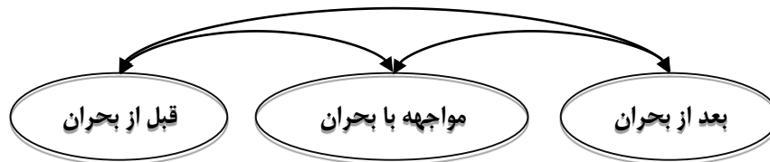
شکل ۴: روابط بین مراحل مدیریت بحران

خلاصه مقایسه‌های انجام شده در جدول (۴)، ارائه شده است: