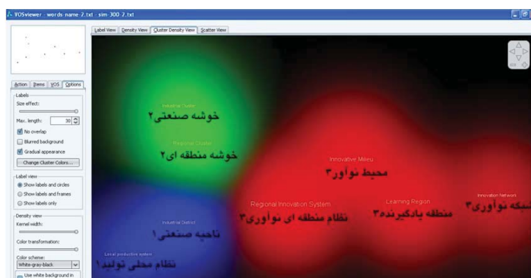
شکل شماره ۴- نمایش تراکم خوشه ای نقشه مفهومی دانش توسعه نوآوری در مناطق

نوشته های فارسی در خروجی نرم افزار وجود ندارد و به جهت واضح تر نمودن شکل به خروجی نرم افزار اضافه شده است. شماره های موجود کنار اسامی فارسی نمایانگر خوشه ها و طیف رنگی مشابه در خروجی نرم افزار می باشد. در شکل شماره ۳ تراکم مفاهیم اصلی شناسایی شده قابل مشاهده است. بر اساس شکل شماره ۳ مفاهیم نظام منطقه ای نوآوری، ناحیه نوآوری، منطقه یادگیرنده دارای بیشترین تراکم هستند.