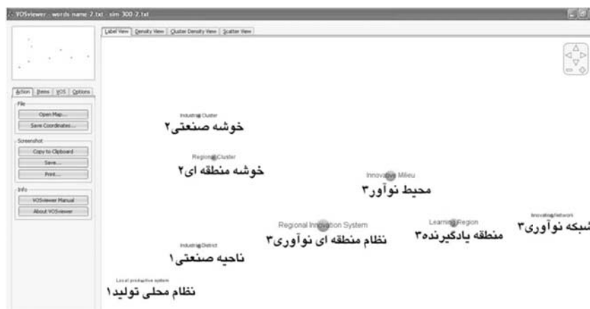
شکل شماره ۲- نمایش عنوان نقشه مفهومی دانش توسعه نوآوری در مناطق

ماتریس ارائه شده در جدول شماره ۲ به همراه نام مفاهیم در قالب فایل متنی به نرم افزار VOSviewer_1.2.1 داده شد و نرم افزار در چهار قالب تحت عناوین نمایش عنوان ۱ ، نمایش تراکم ۲ ، نمایش تراکم خوشه ای ۳ و نمایش پراکندگی ۴ اقدام به ترسیم نقشه دانشی کرد. نتیجه استخراج شده از نرم افزار در قالب شکل های شماره ۲، ۳ و ۴ ارائه شده است که هر کدام بخشی از واقعیت های این نقشه دانشی را به تصویر می کشد.