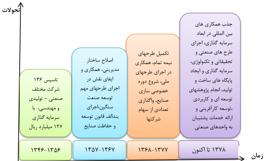
نمودار ۱. تاریخچه و فعالیت ها و تحولات ایدرو از زمان تأسیس تاکنون

تولید وسیع کالاهای مورد نیاز، اجرای طرح های مهم توسعه صنعت سنگین، اجرای بند الف قانون توسعه و حفاظت صنایع که به موجب آن بخشی از صنایع سنگین و مادر، ملی اعلام شد و اداره آنها به سازمان گسترش و انگذار گردیده است. در دهه سوم (۱۳۶۷-۷۷) همزمان با اجرای برنامه های توسعه اول و دوم فعالیت های عمده ای انجام شدند؛ تکمیل طرح های نیمه تمام، همکاری در اجرای طرح های مهم ملی؛ مثل پالایشگاه های نفت و گاز و پتروشیمی و احداث نیروگاه ها، همچنین شروع دوره خصوصی سازی صنایع و واگذاری تعدادی از سهام شرکت ها است. در دهه چهارم که از سال ۱۳۷۷ تاکنون می باشد سازمان گسترش و توسعه صنایع با بررسی عملکرد ضعیف گذشته، استراتژی ها و ماموریت های دهه آینده را جذب همکاری های بین المللی در ابعاد سرمایه گذاری، اجرای طرح های صنعتی و تحقیقات تکنولوژی، سرمایه گذاری و ایجاد پایگاه های ساخت و تولید، انجام پژوهش های توسعه ای و کاربردی، توسعه کارآفرینی و تربیت مدیران کارآفرین، توسعه پیمانکاری های عمومی و ارائه خدمات پشتیبانی به واحدهای صنعتی بیان کرده است که تمامی این تغییر و تحولات در نمودار ۱ بیان شده است. شرکت های سازمان گسترش و نوسازی صنایع ایران شامل ۳۷ شرکت می باشد که عبارتند از؛ ایران خودرو، سایپا، سازمان مدیریت صنعتی، صنایع کشتی سازی، توسعه صنایع نفت و گاز گسترش ایران، مدیریت طرح های صنعتی ایران (IPMI) و ... (صمت، ۱۳۹۸).