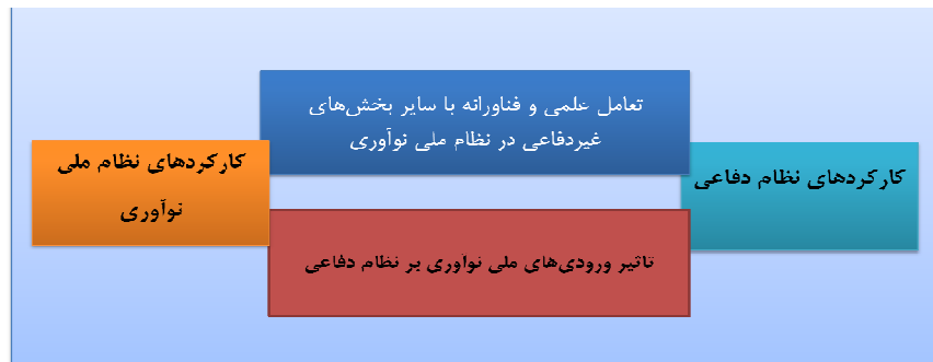
شکل ۳- ارتباط متقابل نوآوری صنعت دفاعی و نظام ملی نوآوری

تعامل موثر نظام نوآوری دفاعی و نظام ملی نوآوری، بدون تعریف و تبیین نقش و وظایف نهادهای مسئول در سطوح بخشی و ملی، امکان تحقق نمی‌یابد. این امر، نیازمند نگاهت نهادی است تا بر اساس آن، نقش و تکالیف هر یک از نهادهای مختلف، در قبال تحقق اهداف تعامل نظام‌های نوآوری دفاعی و نوآوری ملی، تبیین گردد.