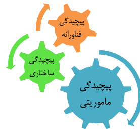
شکل ۲- پیچیدگی های درونی نظام نوآوری صنعت دفاعی

از آن جاکه این نوآوری ها عمدتاً در یک مقطع خاص تاریخی به وقوع پیوسته و بر شماری از عوامل و پیشران های بومی و پیچیدگی های درونی نظام نوآوری دفاعی مبتنی بر فن آورانه، ساختاری و ماموریتی بوده، ضروری است که ابعاد و زوایای پنهان آن ها روشن شده و در قالب نظریه یا الگویی بومی تدوین گردد تا از این طریق بتوان تجارب و آموخته های نسل اول انقلاب را مورد تحلیل قرار داد و به نسل های بعد منتقل نمود. از سوی دیگر، چنان که اشاره شد، نوآوری، یکی از حوزه هایی است که مورد توجه و مطالبه مستمر فرماندهی معظم کل قوا از بخش صنعت دفاعی بوده است (شکل ۱).